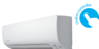
CTXS-K / FTXS-K

Économies d'énergie A++ / A++ > Niveau sonore réduit 19 dB(A) > Détecteur de présence