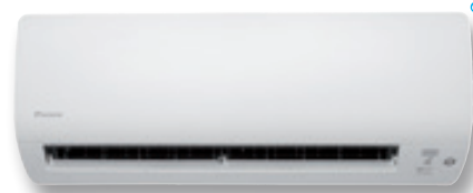
CTXS-K / FTXS-K