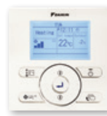
BRC073 en option